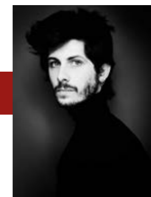
DOMENICA 21 AGOSTO | ORE 17:30 MUPRE HERMES MEREGHETTI OLTRE IL RITRATTO