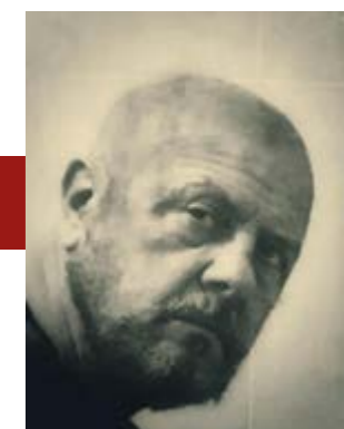
DOMENICA 28 AGOSTO | ORE 21:30 MUPRE EROS MAURONER LA FOTOGRAFIA TRA REALTÀ, FINZIONE E RAPPRESENTAZIONE