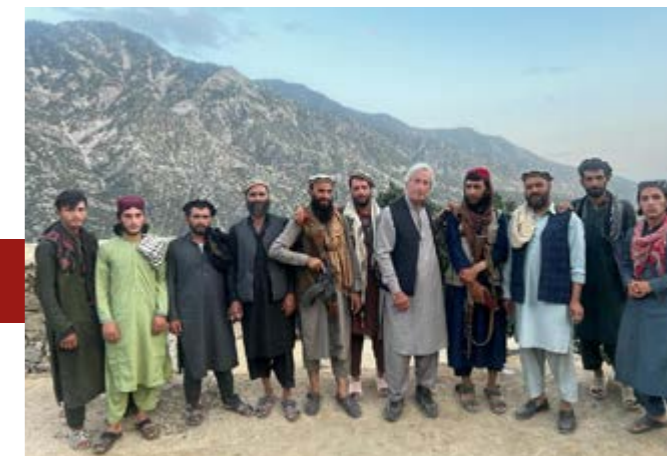
SABATO 3 SETTEMBRE | ORE 21:30 | MUPRE UGO PANELLA UNA STORIA AFGHANA LUNGA 43 ANNI